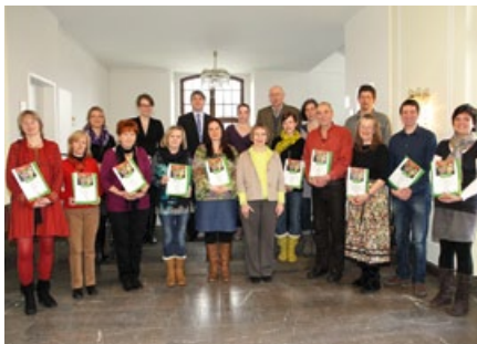
2. Prämierung 21. März 2013

Während der 2. Stufe konnten die Kitas ihre Vorhaben weiter ausbauen. Zur fachlichen Fortbildung fand am 12. Oktober 2012 die 5. Fachtagung »Gartenträume gemeinsam gestalten – unser Kinder-Garten als Ort des Miteinanders« statt (siehe Kapitel 1.4). Am Ende der 2. Stufe wählte die Fachjury zehn Kitas (siehe Kapitel 2.2) aus, welche am 21. März 2013 offiziell mit Vergabe des Preisgeldes in Höhe von 1.000 Euro je Kita ausgezeichnet wurden.