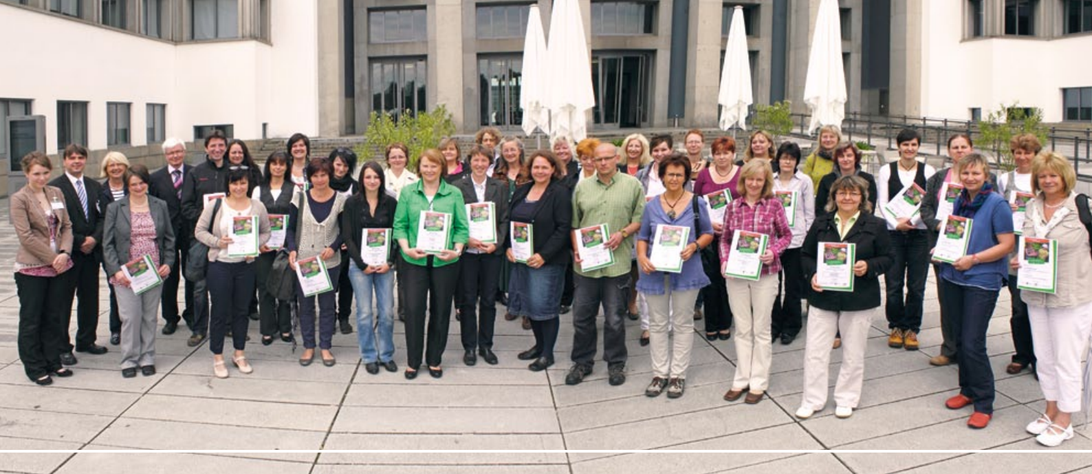
1. Prämierung 11. Juni 2012