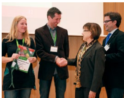
14. Oktober 2013 – Auszeichnung durch Brunhild Kurth, Staatsministerin für Kultus