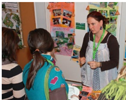
6. Fachtagung 2013