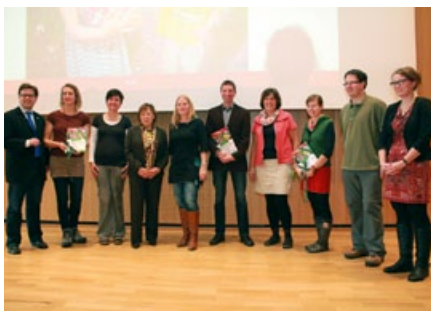
3. Prämierung 14. Oktober 2013

Auch während der 3. Stufe hatten die Kitas Gelegenheit, ihre Projekte zur Gartengestaltung weiter zu entwickeln. Im Rahmen des Begleitprogramms zum Wettbewerb fanden vom 28. bis 31. Mai die Exkursionen zu den Landessiegern des 2. Wettbewerbes statt. Die 6. Fachtagung »Unser Kinder-Garten – für Alle von Anfang an« wurde am 14. Oktober 2013 durchgeführt. Vom 02. bis 05. September 2013 wurden die zehn Einrichtungen durch die Fachjury vor Ort besucht, welche am Ende der 3. Stufe aus den zehn Kitas die drei Landessieger auswählte (siehe Kapitel 2.3). Die Landessieger wurden am 14. Oktober 2013 im Rahmen der 6. Fachtagung offiziell von Staatsministerin Kurth mit je einem Preisgeld von 2.500 Euro ausgezeichnet.