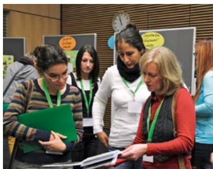
5. Fachtagung 2012